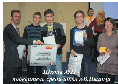
Школа №22 – победитель среди школ г.В.Пышма