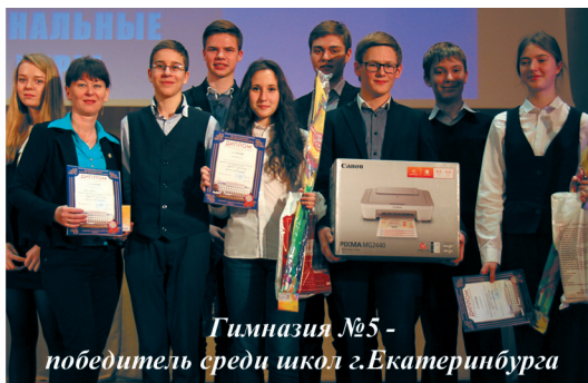
Гимназия №5 – победитель среди школ г.Екатеринбурга