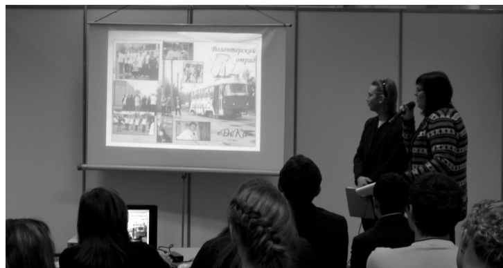
Круглый стол «Активная жизненная позиция современной молодежи: от комсомола до наших дней»

11 НОЯБРЯ – студенты колледжа в составе отряда «ДеКа» участвовали в молодежной конференции волонтерских отрядов: «Кто, если не мы!» – и это не просто название, это девиз, миссия почти 500 лидеров-добровольцев, собравшихся вместе для того, чтобы больше узнать