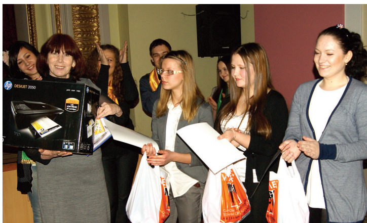
Победитель интеллектуально-развлекательной игры «Путь к успеху» – команда школы №176

Благодарим всех участников игры и руководителей школ за активное участие и содействие в организации игры «Путь к успеху»!