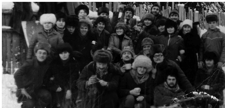
Студенты – победители декады на пикнике, 1972 год

Проведение таких декад-недель стали традиционными, до сих пор студенты с интересом участвуют в них.