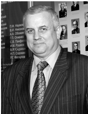
Здравствуйте, уважаемые читатели нашей газеты!

Учебный год вступил в свою вторую половину – проблема выбора профессии становится острой, и решение нельзя откладывать. Как выпускнику общеобразовательной школы сориентироваться в море услуг, предлагаемых сегодня на рынке профессионального образования? И высшее, и среднее профессиональное образование имеет свои плюсы, но я, как директор колледжа, обозначаю преимущества получения профессии через систему СПО (среднее профессиональное образование). Называю их: