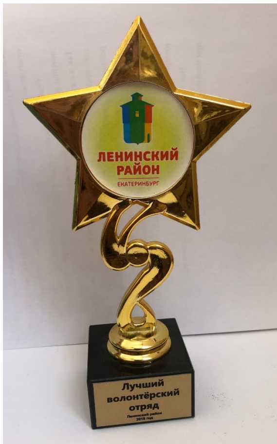
Лучший волонтерский отряд Ленинского района г. Екатеринбурга 2018 год

В документе собраны особенно значимые награды, которые были вручены как отряду, так и волонтерам за их заслуги. В общей сложности отряд имеет около ста грамот и благодарностей за последние 3 года.