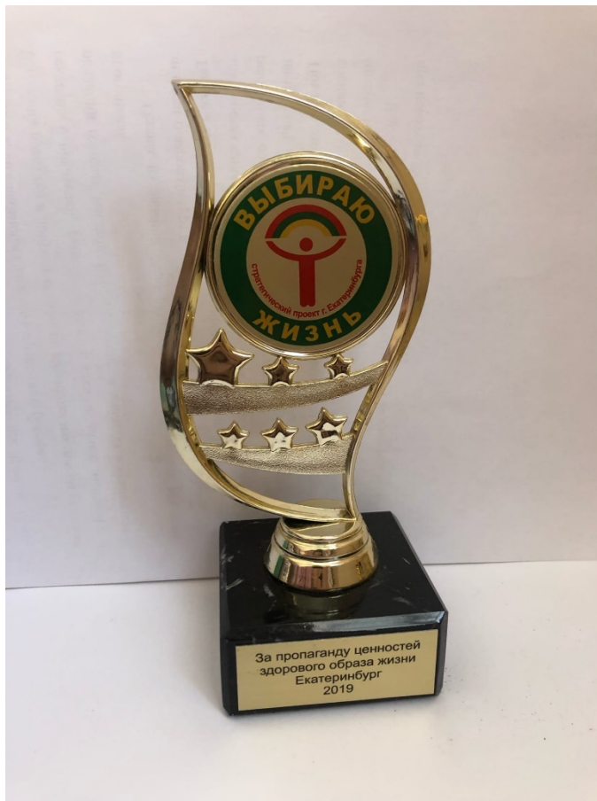
Студенческий проект г.Екатеринбурга «Выбираю жизнь». Статуэтка за пропаганду ценностей здорового образа жизни 2019 год